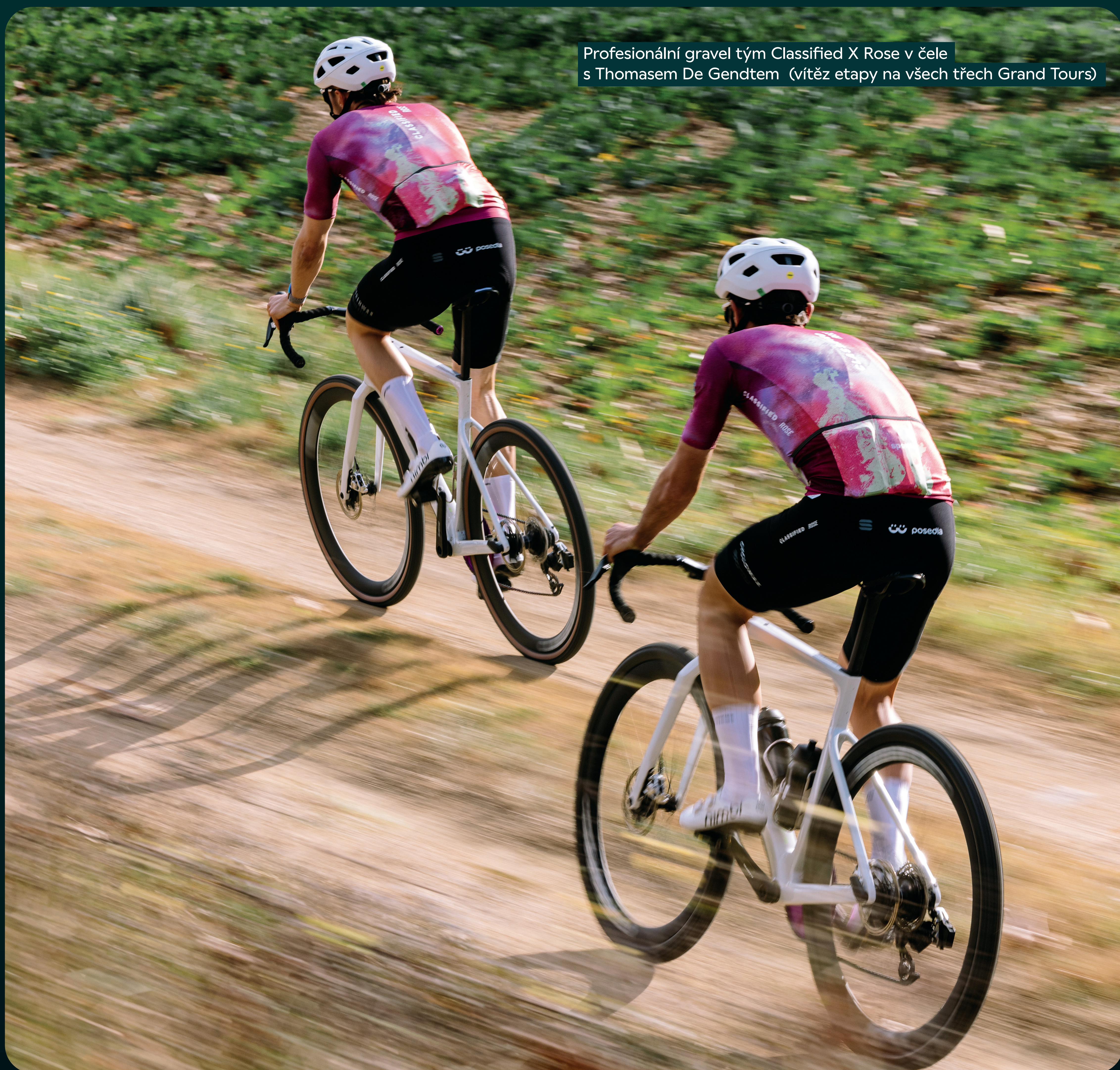
Profesionální gravel tým Classified X Rose v čele s Thomasem De Gendtem (vítěz etapy na všech třech Grand Tours)

Ve více než 50 zemích světa už jezdí spokojení zákazníci na sedle, které respektuje jejich unikátní anatomii a styl jízdy. Jsou mezi nimi silničáři, gravelisté, bikeři, profi jezdci, ale i ti, kteří s kolem teprve začínají. Komfort je totiž pro každého. Dopřejte si pohodlnou jízdu v sedle, ať už je váš roční nájezd jakýkoli.